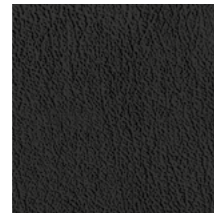
J02 Black Nero