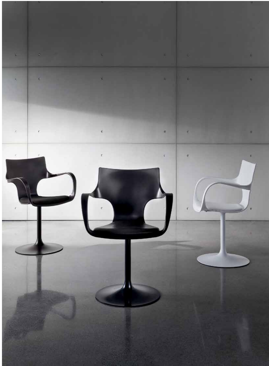
Flûte girevole structure PC seat E05. Flûte girevole structure GN seat E04. Flûte girevole structure GB seat E01.