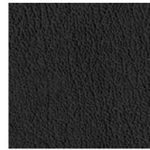
E04 Black Nero