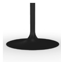
GN Embossed black Nero goffrato