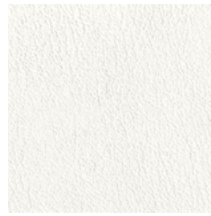
J01 White Bianco