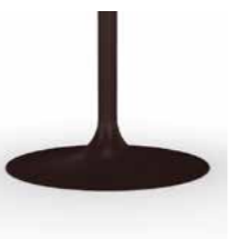
GC Embossed Mocha Caffè goffrato