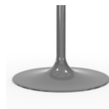
LC Polished chrome Cromo lucido