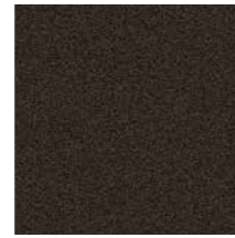
PC Mocha Caffè