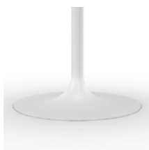
GB Embossed white Caffè goffrato